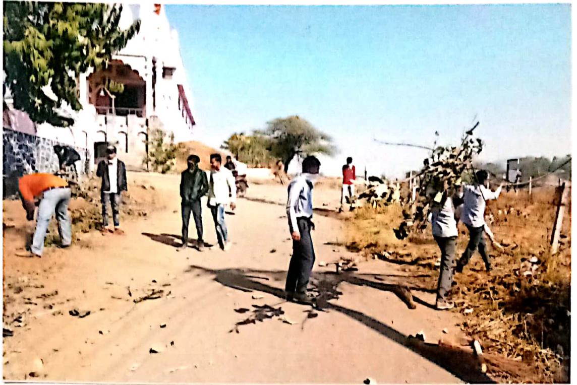
Before "During the work"

N.S.S. volunteers working during the camp