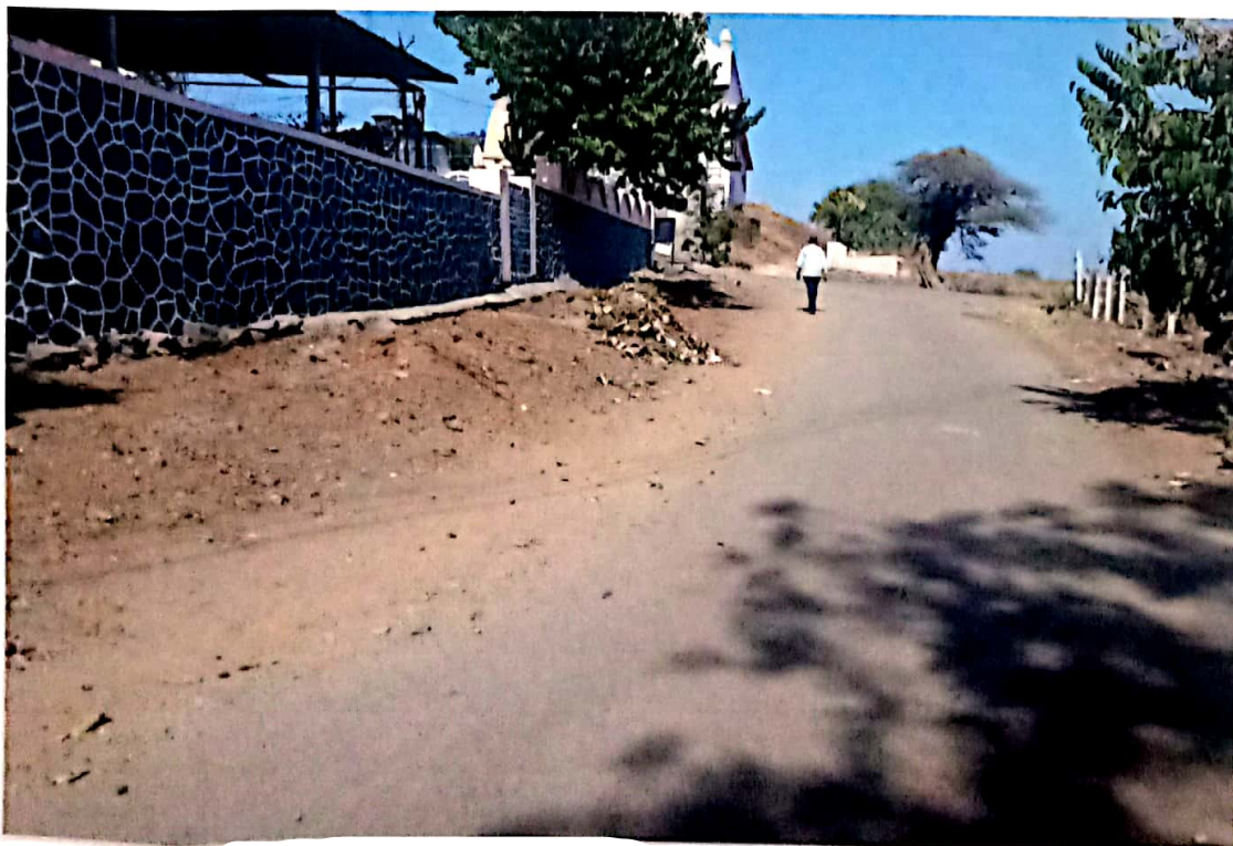
"After the work"